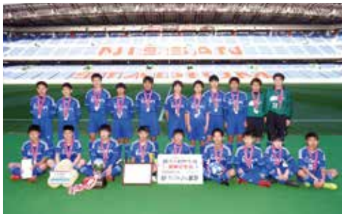
小学生男子の部は、小学生男子の部、小学生女子の部、中学生の部で行われた。