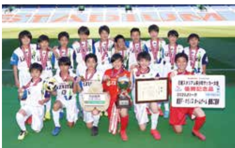
第22回日産スタジアム杯少年サッカー大会は、小学生男子の部、小学生女子の部、中学生の部で行われた。

小学生男子の部 泉区選抜 小学生女子の部 港北区選抜 中学生の部 桐蔭学園中学校