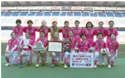
小学生の部は男女共に各区選抜チームによる大会で、それぞれ予選リーグを行い、各リーグの1位チームで決勝トーナメント戦を行った。